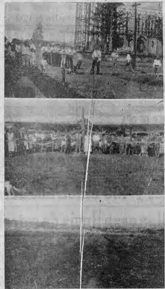
Parte superior: la filarmónica de San Ramon; centro, público que asistió a la bendición del campo de aterrizaje de aquella localidad y parte inferior, el campo de aterrizaje.

La inauguración del campo de aterrizaje de San Ramon, que se verificó el domingo, resultó muy lucida. Desde las primeras horas de la mañana se había reunido en el aeródromo un enorme gentío, que daba una nota de entusiasmo y alegría.