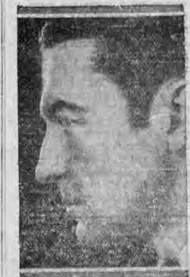
Clive Brook in the Paramount Picture

Una semana con dos colosales es la semana del Raventós. Se trata de la enorme SUPER JOYA DE ORO, marca FOX, titulada MARIDO Y MUJER.